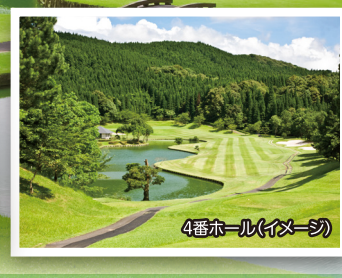
4番ホール(イメージ)