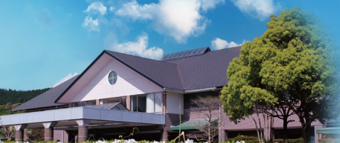
クラブハウス外観

杉林でセパレートされた、自然美と造形美が見事に調和させたチャンピオンコース。 大きな池が随所に配置された高い戦略性が特徴で、 特に美しい景観の池越えホールが魅力です。