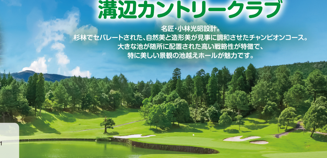
7番ホール(イメージ)