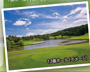
13番ホール(イメージ)