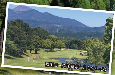
横川コース16番ホール(イメージ)

好天時はコース内へ乗用カート乗り入れ可能なダイナミックなカジュアルコース。 広々としたフェアウェイで、豪快なショットを楽しめ、 初心者や女性ゴルファーにも大人気。