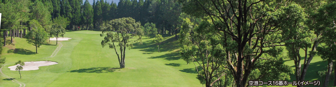
空港コース16番ホール(イメージ)