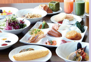
スカイリトルブッフェ GOCOCU ~五国のめぐみ~

都市にしながら開放感たっぷりのリゾート気分が味わえる都市型リゾートとして人気! 幻想的なライティングと心地よい夜風が魅力的「ポートピアナイトプール」は、若い世代を中心にSNS映えスポットとして人気を集めています。