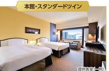
本館・スタンダードツイン

GOCOCUの名物朝食メニュー、ローストビーフめしのほか、兵庫五国で育った食材や国内外から取り寄せた選りすぐりの食材を使用したメニューをご用意しております。