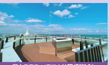
屋上テラス ソラフェ神戸(別料金)

本館屋上、高さ約110mに誕生した展望デッキ兼ルーフトップバー。神戸の街、六甲の山並み、大阪湾などを一望する絶好のロケーション。夜は1000ドルと称される神戸の夜景をお楽しみいただけます。