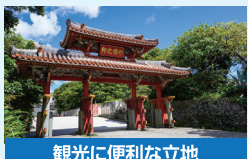
観光に便利な立地

那覇空港から車で約30分。那覇インターチェンジから車で10分。首里城守礼門へは徒歩13分。国際通りまで車で約10分。静かな首里に居ながらアクセスが便利なロケーションです。