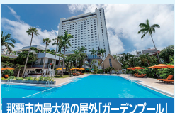
那覇市内最大級の屋外「ガーデンプール」

那覇空港から車で約30分。那覇インターチェンジから車で10分。首里城守礼門へは徒歩13分。国際通りまで車で約10分。静かな首里に居ながらアクセスが便利なロケーションです。