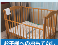
お子様へのおもてなし

南国らしい木々や花々に囲まれ、都会にいなながらもまるでオアシスのような空間。子供向けプールは水深65センチメートルと家族旅行でも思いっきり楽しめます。