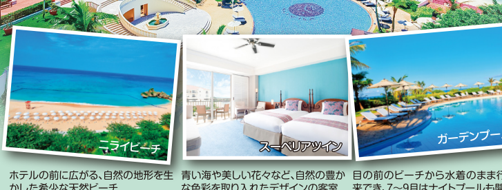
ホテルの前に広がる、自然の地形を生かした希少な天然ビーチ 青い海や美しい花々など、自然の豊かな色彩を取り入れたデザインの客室 目の前のビーチから水着のまま行きて、7~9月はナイトプールも開催

朝食付2,500円追加 洋食バイキング/和定食 当日選択可 (通常価格3,600円) 朝食をランチに変更OK(当日利用に限る) 「プレミアツイン」アップグレード 5階以上の高層階にあり、開放感あふれるワイドビュー 2名様 おひとり様1泊あたり 1室利用 5,000円追加