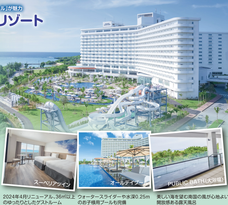
2024年4月リニューアル、36㎡以上 ウォーターライダーや水深0.25m 美しい海を望む南国の風が心地よいのゆったりとしたゲストルーム お子様用プールも完備 開放感ある露天風呂