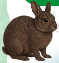
アマミクロウサギ (国の天然記念物)