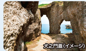
穴の門蓋(イメージ)

奄美群島の有人島の中で2番目に小さな島。文化遺産としては、ウケユリや旧奉安殿などがあります。集落の聖地ウヤマ(大山)のミョーチョンという場所があり、そこからは徳之島を見ることができる場所であり、昔はそこから神様が鉦を叩いて降りてくるといわれていました。