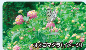
オオコマダラ(イメージ)