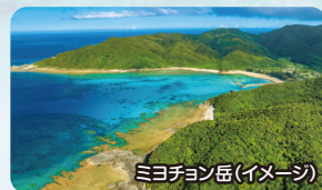
ミヨチヨン岳(イメージ)

奄美群島の有人島の中で最も小さな島で41世帯73名が暮らしています。ハブが生息する為、隣の請島と同様に、集落には「用心棒」(「ハブ棒」と呼ばれるハブを退治する為の棒が立てかけてあり、リュウキュウイノシシも生息しています。また、集落に広がるサンゴの石垣は国交省「島の宝100景」にも選ばれた、歴史ある風景です。