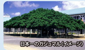
日本一のカジュマル(イメージ)

鹿児島市から南へ約468kmの場所に位置する、周囲およそ89kmの島で、奄美群島で2番目に大きな島です。主な産業はサトウキビ、ジャガイモ、果樹などの農業や、近海漁業、黒糖を原料とした菓子、黒糖焼酎製造などがあります。闘牛が盛んな島としても有名で、年に数回大きな大会が開催されます。