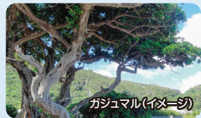
ガジュマル(イメージ)

奄美大島の東へ位置する周囲約48.6kmの島で、島の大半が隆起サンゴ礁で年間数ミリずつ隆起し続けています。主な産業は農業で島一面にサトウキビ畑が広がり、サトウキビから作られる黒糖、黒糖焼酎は島の特産品となっており、また国内最大のゴマの産地としても知られています。オオコマダラやサギマダラなどの蝶が舞い飛び、近年ではダイビングスポットとしても注目されています。