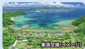
集落空撮(イメージ)

奄美大島の南端の町の古仁屋港から加計呂麻島までは、フェリーで20分ほどで行けます。島内にはあちこちに「シマ」と呼ばれる集落がありますが、人口はわずか1400人ほどの小さな島で、神が宿るといわれる木・ガジュマルを見ることが出来ます。熱帯地方に生息するクワ科の大きな木で、幹が複雑に絡み合う様はとて神秘的です。