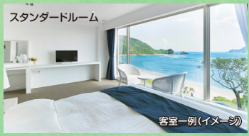
スタンダードルーム

ディナーでは地元の素材を丁寧に調理をしたイタリアンや和食をご用意。朝食は地元の食材を使った料理や奄美の郷土料理をピュッフェスタイルで提供。※ディナーは日替わりでのご案内となります。