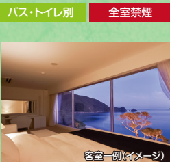
客室一例(イメージ)

白と紺を基調とした清潔感あふれる30mのお部屋。壁一面の窓から大島海峡のパノラマビューがご覧いただけます。