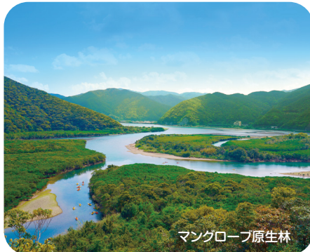
マングローブ原生林

昔の人々はこの滝ツボに美しく写り輝く太陽の影を見て「本当に美しい太陽の滝ツボ」と称讃し、いつの間にか「マテリアの滝」と呼ぶようになりました