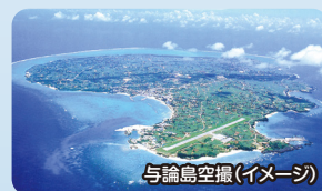
与論島空撮(イメージ)

鹿児島市から南へ約552kmの場所に位置する周囲約55.8kmの隆起サンゴ礁の島。和泊、知名の2町から成り立ち、人口約12,000人が住んでおり、地下には多数の鍾乳洞が存在し「花と鍾乳洞の島」の異名をもっています。澄みきった青い海と空、まばゆい太陽、素朴で厚い人情は、忘れ得ぬ旅の思い出を演出することでしょう。